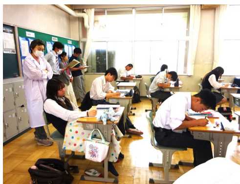
写真(1) 相互授業参観の様子