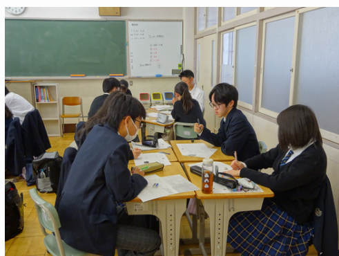
写真(3) グループでの言語活動の様子